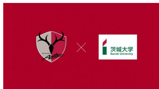
図5 《アントンのえかきうた》の最終場面