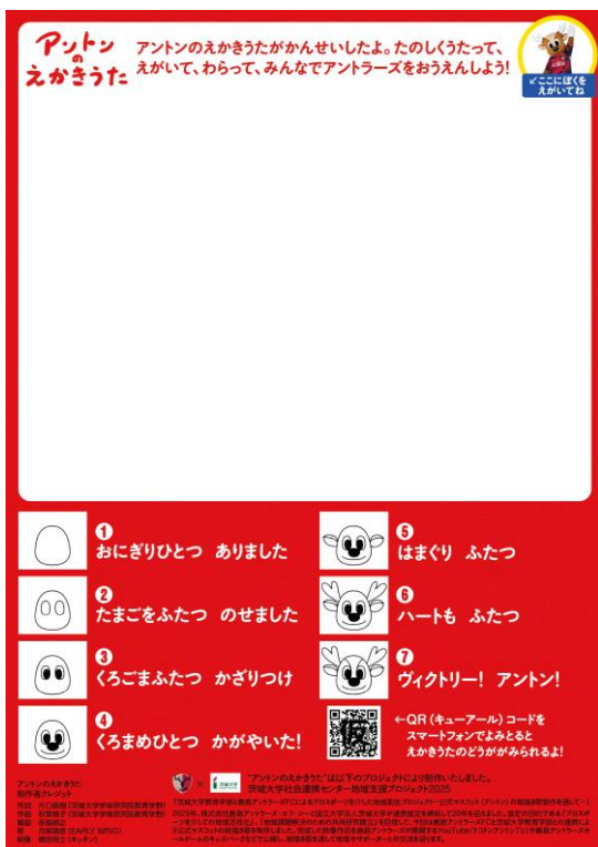
図6 《アントンのえかきうた》のおえかきシート

になるであろう。また、描き順を①から⑦に分けて示すことで、描くことが苦手な方も取り組めるようにした（図6）。