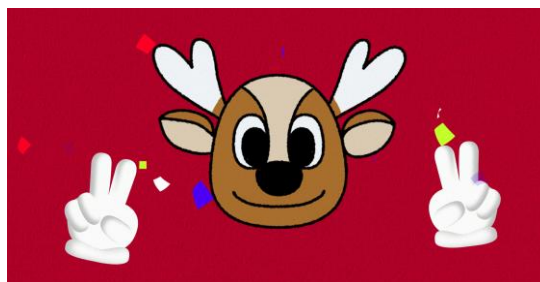
図4 《アントンのえかきうた》の完成場面