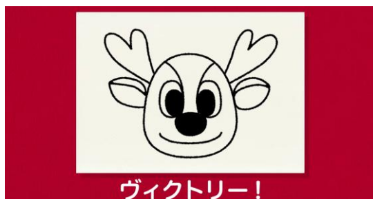
図3 《アントンのえかきうた》の一場面